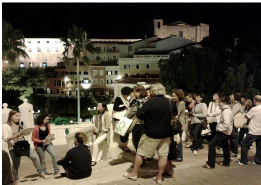
L'oferta cultural de fer itineraris literaris compta amb un públic cada vegada més nombrós

Si l'activitat l'organitza un administració pública, la gent es pot inscriure a través d'aquesta. No obstant això, Illetra és molt present a les xarxes socials (Facebook i Twitter) i també es poden posar en contacte amb nosaltres mitjançant el nostre correu electrònic ( illetra.cultura@gmail.com ). En aquests moments estam treballant en la pàgina web.