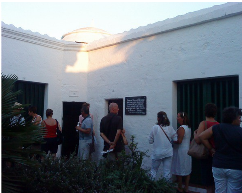
La Ruta Albranca fa una aturada al cementeri des Migjorn Gran, a la caseta on reposa el folklorista menorquí

Ara bé, si ens centram a la nostra illa, tenim “Gumersind Gomila i la ciutat literària de Maó”, a càrrec de Josefina Salord; la “Ruta Francesc d'Albranca”, elaborada l'any 2002 per la mateixa autora i institucionalitzada uns anys més tard per l'Ajuntament des Migjorn Gran i el Centre d'Estudis Locals d'Alaior, que l'han inclosa dins l'oferta cultural des Migjorn tots els dimarts d'estiu, i “Itinerari ciutadellenc de la mà de Francesc de Borja Moll”, de Gabriel Julià Seguí (2003), dissenyades aquestes dues per commemorar els anys dedicats a sengles escriptors. Amb aquestes dues rutes podem gaudir d'una caminada per Maó, pes Migjorn Gran i per Ciutadella, respectivament, i aturar-nos a aquells indrets lligats a la vida i a l'obra dels dos autors, on la persona que guia la ruta llegeix fragments de les seves obres que fan referència al lloc en qüestió.