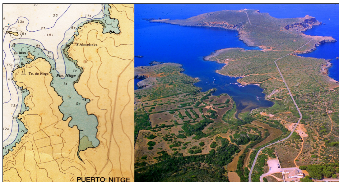
Fig. 1-2. Mapa y fotografía aérea del puerto de Sanitja (Es Mercadal – Menorca)

Esta publicación tiene como objetivo dar a conocer el estudio de un conjunto de materiales anfóricos de procedencia tunecina correspondientes a los siglos III y IV d.C. identificados a lo largo de varias campañas de prospecciones subacuáticas efectuadas por el Ecomuseo de Cap de Cavalleria y la recopilación de materiales consultados en varias publicaciones anteriores a 1993.