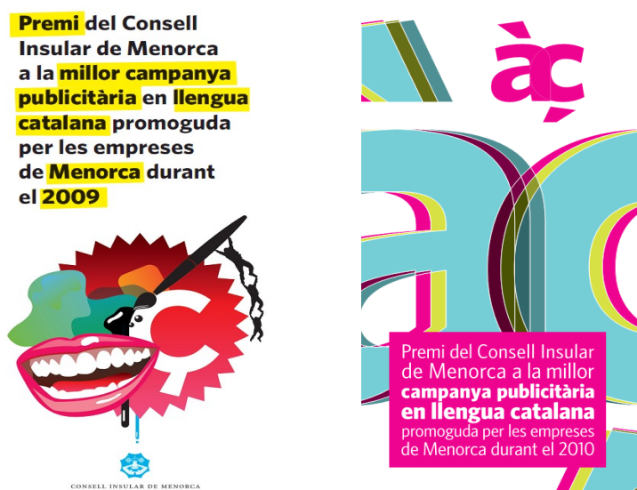
Díptics de les convocatòries de 2009 i 2010

Aquest és un premi que té l'objectiu de premiar la iniciativa privada que empra la nostra llengua per publicitar-se i, al mateix temps, pretén fomentar el català en l'àmbit empresarial. D'aquesta manera, el Consell Insular dóna suport a l'empresariat menorquí que utilitza la llengua catalana en la publicitat dels productes i serveis que ofereixen les seves empreses i promou el català com a llengua d'ús habitual de la feina, dels productes, de l'etiquetatge, de la publicitat i dels serveis de les empreses de l'illa.