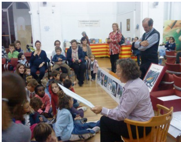
Sessió de contacontes a Alaior (novembre 2011)