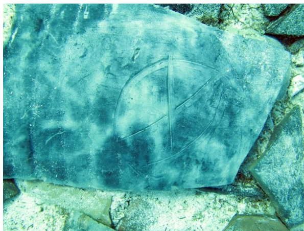
Panxa d'una àmfora ibèrica amb marca

Alguns fragments de panxa d'aquestes àmfors ibèriques que hem recuperat porten marques fetes abans de la cocció de la peça, tal com ja va passar en l'excavació de l'any 1975. En aquest moment aquestes marques estan en estudi per poder-ne esbrinar el significat i la funció.