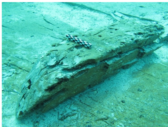
Quaderna del vaixell

A la campanya d'aquest any hem tingut la sort de poder documentar un fragment de quaderna que encara estava lligada a les traques del buc del vaixell i que ens ha permès de veure que aquests elements tenen una secció trapezoïdal, alhora que hem pogut estudiar com es lligaven les quadernes al buc del vaixell.