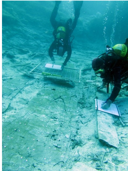
Treballs de registre de l'arquitectura naval

Pel que fa a l'arquitectura naval del vaixell, al seu sistema constructiu, en les excavacions de l'any 1975 i en els nostres estudis de l'any 2006 ja es va poder documentar que es tractava d'una embarcació construïda a folre primer, en la qual s'uneixen les traques per mitjà de llengüetes i mosses. Sobre les traques es van poder identificar uns grups de forats que per la disposició ens van indicar que les quadernes del vaixell anaven cosides a les traques, i gràcies a les empremtes que aquestes havien deixat sobre les traques vàrem poder intuir que la seva forma seria trapezoïdal.