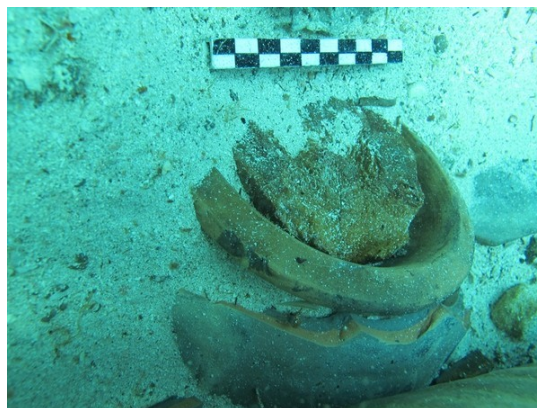
Àmfora ebusitana PE-22 amb el seu tap de llenya

Aquesta peça juntament amb un tap de llenya que tapava la boca d'una de les àmfores PE-22 i alguns fragments més de llenya de l'estructura del vaixell es troben actualment als laboratoris del Centre Nacional d'Arqueologia Subaquàtica de Cartagena per a la seva total recuperació i conservació.