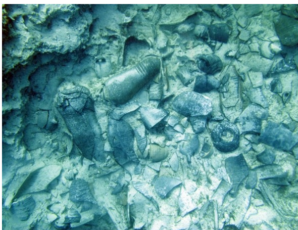
Jaciment zona nord

Un dels projectes executats va ser una primera campanya d'excavacions arqueològiques subaquàtiques al derelicte de Binissafúller, que està situat al sud de Menorca, al terme municipal de Sant Lluís.