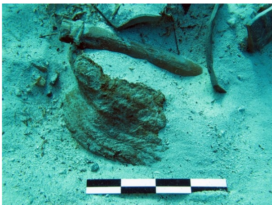
Cistell de cànem amb ansa de llenya

Sens dubte, la peça més espectacular va ser la recuperació d'un cistell de llata, que segons vàrem poder apreciar es conserva gairebé en la seva totalitat. Conservava, encara intacta, l'ansa feta d'un fragment de barra circular de llenya.