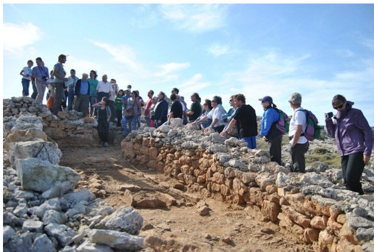
Jornada de portes obertes al jaciment des Coll de cala Morell celebrada el 22 d'octubre del 2011

A banda de la vessant purament científica, també es pretén crear un marc de col·laboració entre institucions de les dues illes i fomentar la participació social en totes les tasques que es realitzen en el context del projecte. L'objectiu final és que tots els recursos invertits en les diferents accions tinguin una repercussió directa sobre les comunitats properes als jaciments i, per extensió, sobre tota la societat illenca. S'ha considerat imprescindible, per tant, programar unes tasques de difusió dels resultats, centrades no només en la restauració i museïtzació dels jaciments, sinó també en l'organització de jornades de portes obertes durant el desenvolupament dels treballs de camp.