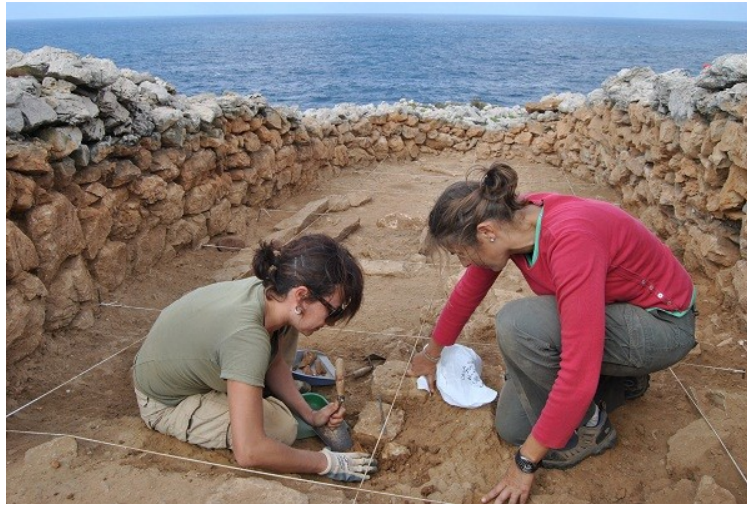
Detall de l'excavació arqueològica a l'interior de la naveta 11

restes d'animals domèstics –cabra, ovella, porc i, sobretot, bou–, confirmen l'ús de la naveta com a espai domèstic. Per altra banda, l'absència de restes d'animals marins –peixos, mol·luscs, crustacis– sembla evidenciar que els habitants d'aquest indret, tot i la proximitat de la mar, no explotaven els recursos marins.