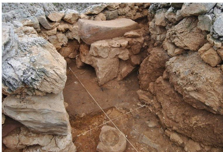
Detall de la base de molí in situ i del morter (aparegut sota l'estructura de fang) davant la façana de la naveta 11

Durant l'octubre del 2011 es va portar a terme la primera campanya d'excavació arqueològica a la naveta 11. Es tracta d'una naveta d'habitació adossada a la murada i orientada al sud. Els treballs arqueològics van permetre documentar-ne l'organització interna, a partir d'una llar de foc central i unes banquetes associades. A l'espai situat davant la façana d'aquest edifici s'hi trobà una base de molí in situ , així com una estructura de fang. Aquests dos elements estan relacionats, segurament, amb feines vinculades a la preparació d'aliments (mòlta de cereals, etc.).