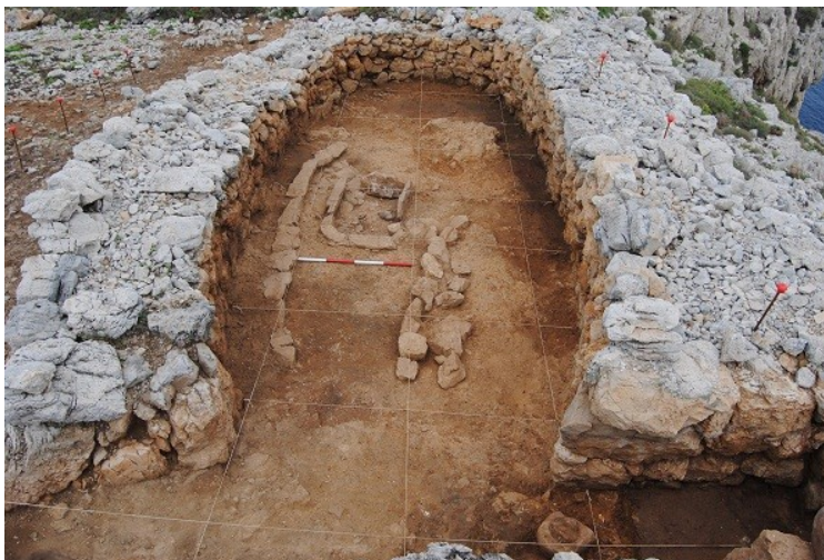
Vista general de la naveta 11 (es Coll de cala Morell, Ciutadella) un cop finalitzada l'excavació arqueològica

La primera intervenció realitzada en el jaciment des Coll de cala Morell fou a mitjans dels anys noranta, quan es va realitzar l'aixecament planimètric de les construccions situades al cap costaner de la mà de Gustau Juan i Lluís Plantalamor.