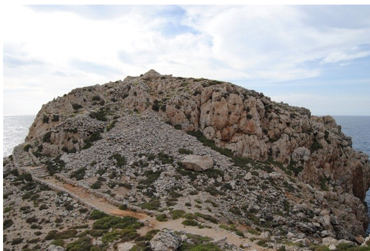
Vista general del cap costaner fortificat de cala Morell

En els treballs més recents dedicats a aquest tipus d'assentaments s'ha interpretat que la seva funció estaria estretament lligada a la navegació i, per tant, als intercanvis comercials. Tot i que no es pretén negar aquesta possibilitat, Entre illes sospesa alguns aspectes complementaris, relacionats sobretot amb la seva ubicació, que consideram que caldria tenir en compte: A l'assentament de cala Morell, igual que as Castellet des Pop Mosquer, fa la impressió que, en el moment d'elegir l'emplaçament, van prevaler els criteris relacionats amb el caràcter inaccessible i defensívol de l'indret, per sobre de gairebé qualsevol altre condicionant. És significatiu que els dos assentaments presentin murades que separen la zona edificada de la zona adjacent, tancant l'istme que uneix el promontori amb l'illa.